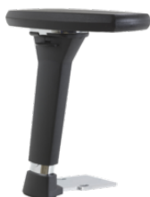
Réf. 1684 Paire d'accoudoirs réglables 4D