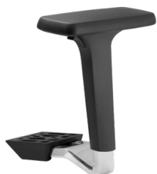
Réf. 1680 Paire d'accoudoirs réglables 4D