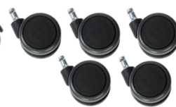
Réf. 10206 Jeu de 5 roulettes grand diamètre