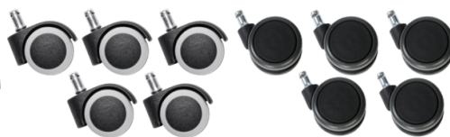
Réf. 10208 Jeu de 5 roulettes sol dur