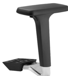
Réf. 1680 Paire d'accoudoirs réglables 4D