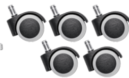
Réf. 10208 Jeu de 5 roulettes sol dur