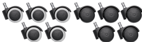
Réf. 10208 Jeu de 5 roulettes sol dur