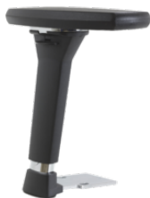
Réf. 1684 Paire d'accoudoirs réglables 4D