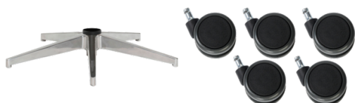
Réf. 9995 Polished aluminium base 9995