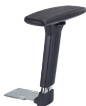
Réf. 1679 Pair of armrests 3D adjustable