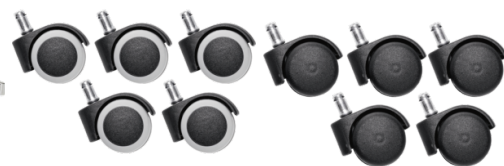
Réf. 10208 Set of 5 castors Hard floor