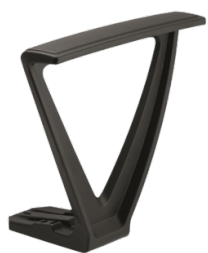
Réf. 1390 Pair of fixed armrests