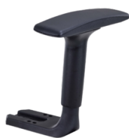
Réf. 1277 Paire d'accoudoirs réglables 2D